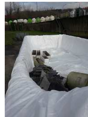
Aux types de déchets à analyser