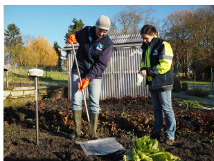
Aux sols wallons

Volonté d'adapter les méthodes de prélèvement