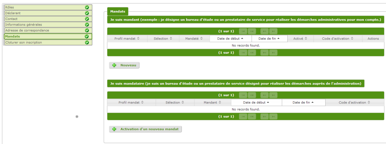
fig. 13. Section Gestion des mandats