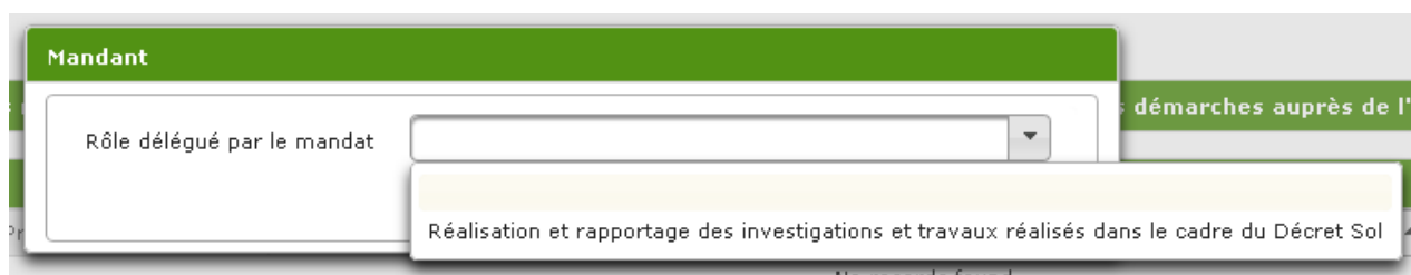
fig. 14. Délégation de la réalisation et du rapportage des investigations et travaux réalisés dans le cadre du Décret sols

Après avoir cliqué sur bouton « Nouveau » dans partie « Je suis Mandant », vous choisissez la délégation du rôle « Réalisation et rapportage des investigations et travaux réalisés dans le cadre du Décret sols ».