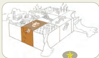
Explication du schéma fiche "La magie du sol"

Pour l'essentiel, la pollution locale des sols est un héritage des pratiques du passé, à une époque où la question des impacts environnementaux et sanitaires des activités humaines était peu prise en compte. D'anciens sites industriels, ou d'anciens lieux de stockage de produits chimiques ou d'hydrocarbures, d'anciennes décharges publiques sont aujourd'hui devenus « infréquentables », du fait de la présence dans le sol, attestée ou probable, de substances dangereuses.