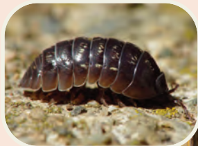
Fiche 4 "Biodiversité"

Les polluants représentent un danger pour les organismes et micro-organismes qui vivent dans le sol . Ces derniers assurent pourtant des services indispensables : décomposition de la matière organique, stabilisation de la structure du sol, épuration des eaux, etc.