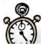
TABLE CHANGE AFTER 20 TO 25 MINUTES