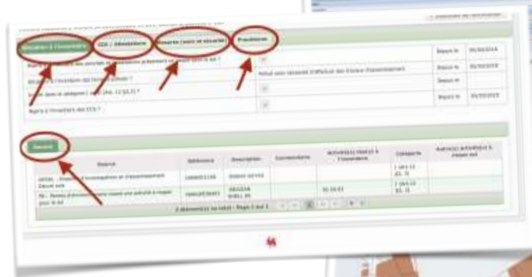
figure est celle que

recherchez. Il est possible que sa référence cadastrale soit légèrement différente.